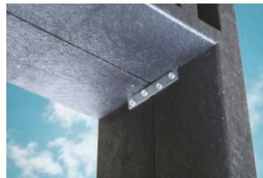
Verbindung von 2 Bänken: durch die Füßen mittels 2 Gova-Fix aneinander zu schrauben. Joining 2 benches by screwing 2 legs to each other using 2 Gova-fix