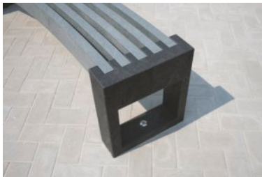
Verankering met behulp van een hulsmoer. Ancrage avec cheville avec filet intérieur

Les pieds sont ancrés avec des tiges filetées et des écrous borgnes traversants en inox. Les pieds ne sont pas percés s'ils ne sont pas commandés avec ancrage. (commander perçage ou bien percer vous-même) Il a un set d'ancrage spécial dans notre gamme pour les bancs Canvas (attention: 1 set par point d'ancrage). Comme des écarts sont toujours possibles, il faut d'abord mesurer la distance entre les pieds, afin de déterminer ou faire les trous dans le sol. Voir également fiche technique ancrages.